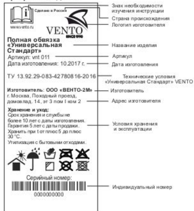
Значение пиктограмм на маркировке