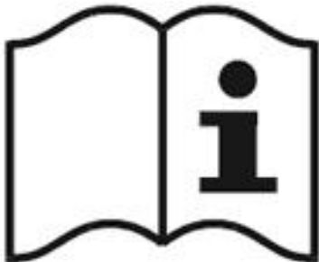
Рисунок 3 - Пиктограмма